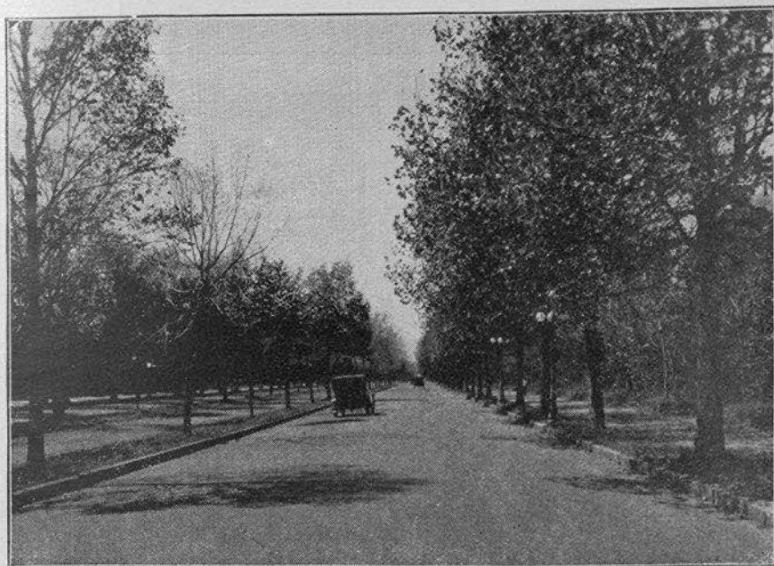
TERRENOS E INMEDIACIONES DE LA CIUDAD UNIVERSITARIA