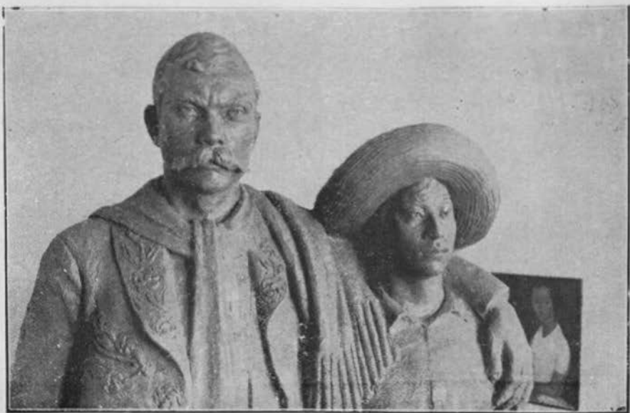
PROYECTO DE MONUMENTO A EMILIANO ZAPATA